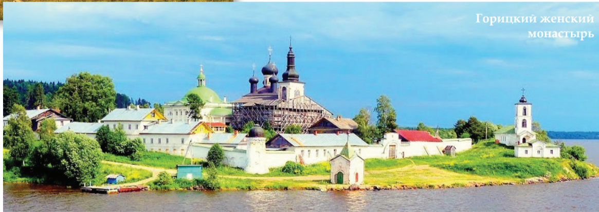
Горицкий женский монастырь

Имей я такую возможность, на базе Горицкого женского монастыря открыл бы Музей бабьего горя. Сколько знатных насельниц сюда